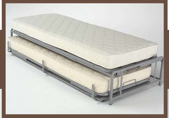
Materasso a molle losangato - Rivestimento 100% cotone. Materasso in poliuretano - Rivestito in cotone losangato.